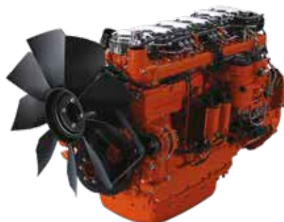
DOC + DPF

Quando attivata, la funzione spegne automaticamente il motore una volta trascorso al minimo un determinato periodo di tempo (da 3 a 60 minuti).